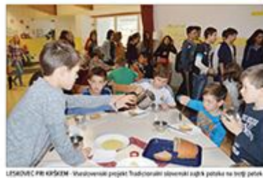
LESNOVICI PRI KRŠKEM - Vstopnice projekta Tradicionalni slavniki sugh k postjka na travni petek v

Časopis za pokrajso Posavje, leto XXV, št. 24, četrtek, 26. november 2015